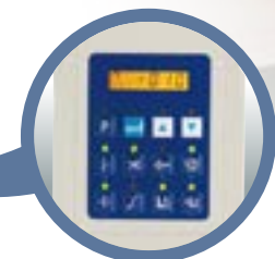
Painel de operacoes