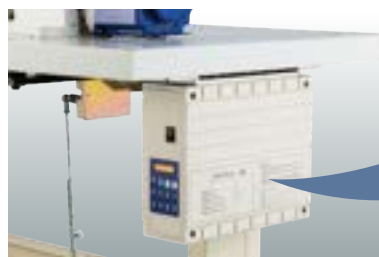
Caixa de controle e painel de operação.